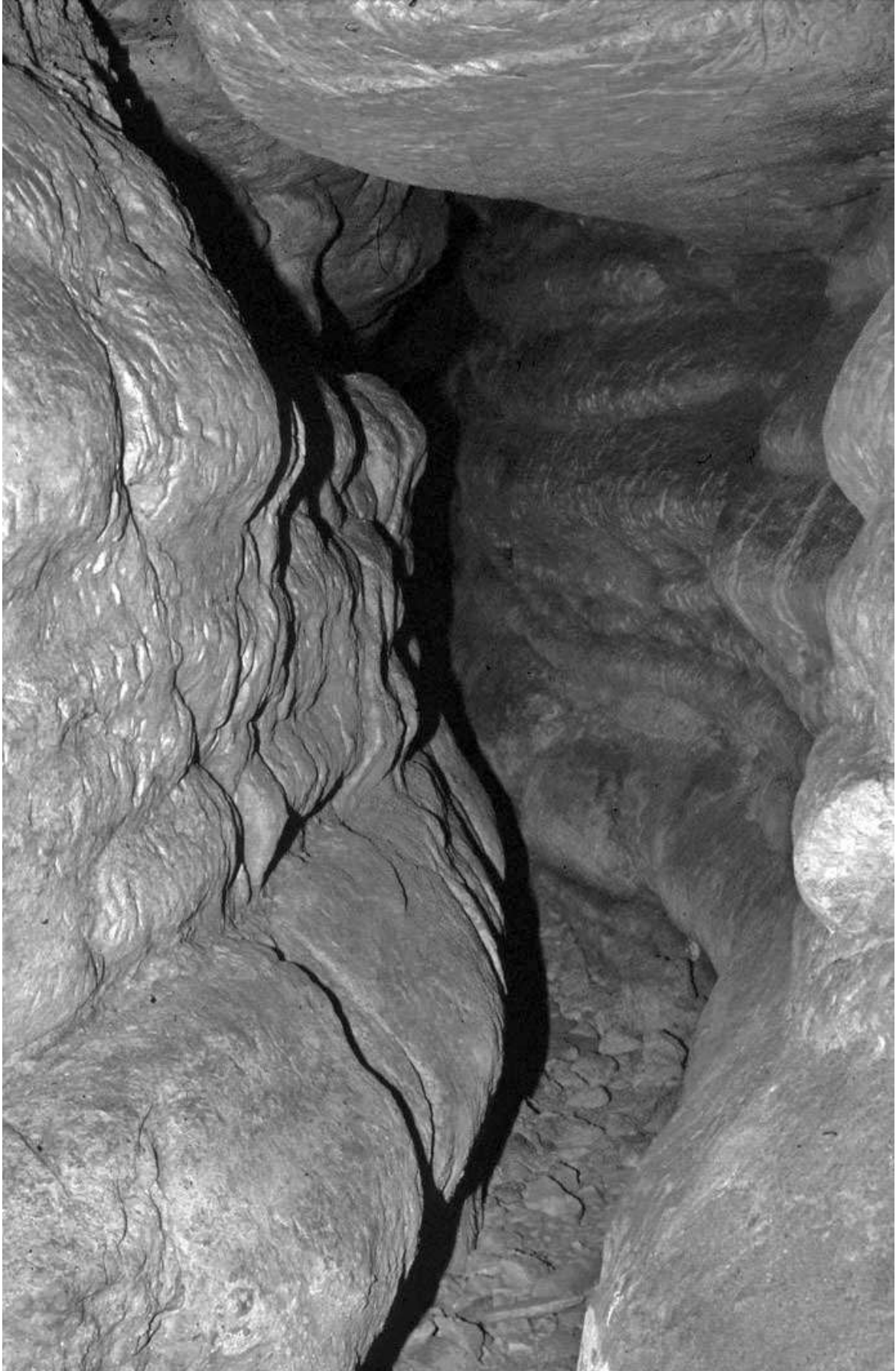
Fig. 3 Miniera "M.T.G. 1": galleria secondaria caratterizzata da evidenti morfologie carsiche.