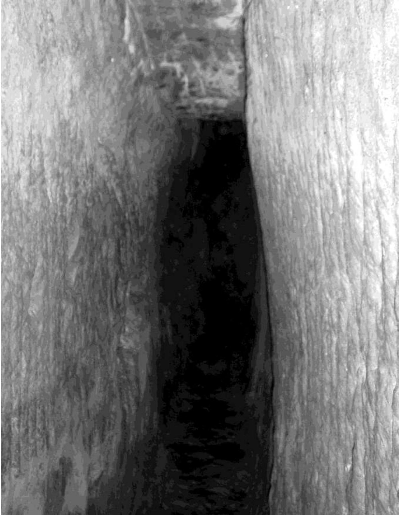
Fig. 12. Sezione tipo della galleria rilevata in corrispondenza del caposaldo C2. Si nota la tipica sezione ogivale tronca della galleria principale.