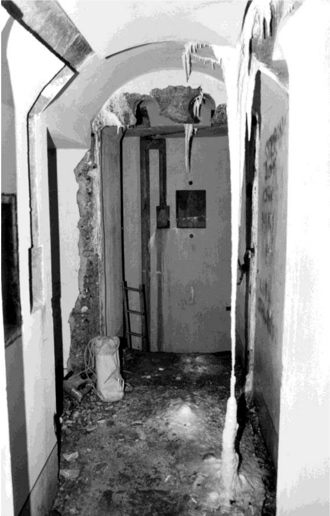
Fig. 52. Concrezioni nel Fortino 3° d'Invillino Ovest.