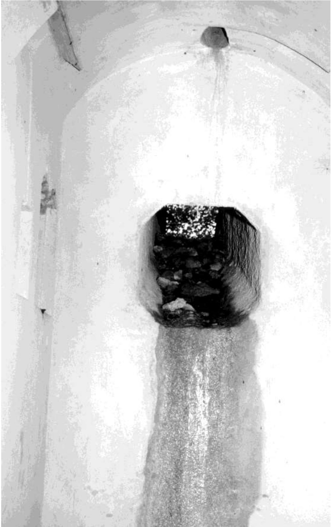
Fig. 18. Condotto fotoelettrico del Fortino 1° d'Invillino Ovest.