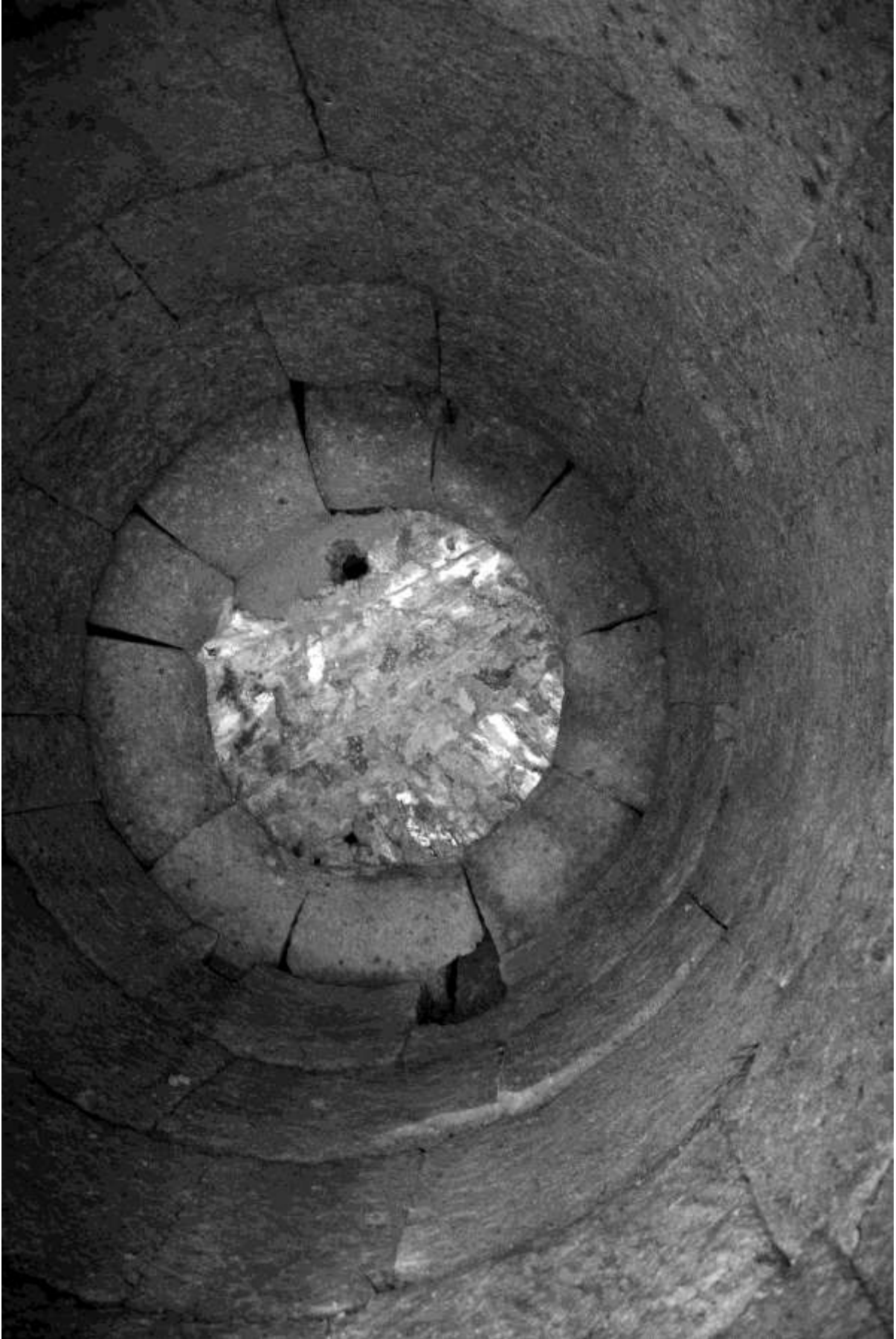
Fig. 6. Cisterna con copertura a mensole aggettanti.