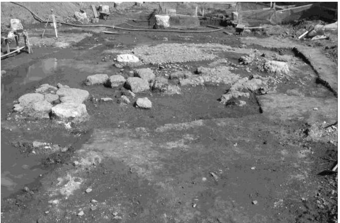
Fig. 9. Panoramica dell'esterno con l'acciottolato medioevale e l'affioramento dei blocchi.