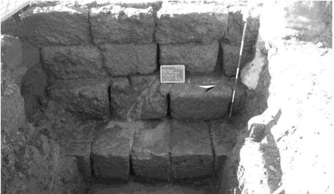
Fig.8. Il muro in opera quadrata.