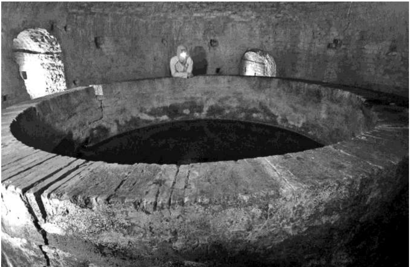
Fig. 7. Vasca di smistamento delle acque denominata La Chioccia, sottostante via Trento.