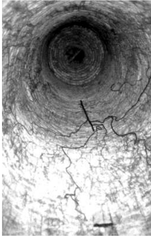
Fig. 6. Pozzo un tempo comunicante con l'esterno nella ex Piana degli Orti.