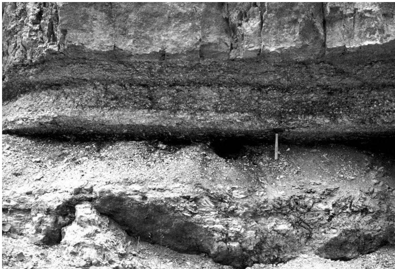
Fig. 2. Affioramento di lignite nell'alto vajo dell'Anguilla.